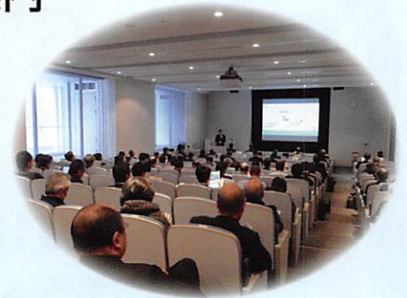
医療機器開発シーズセミナー

医産学官の連携促進を目的に、医工連携コンソーシアムを設立し、医工連携でご活躍の先生方を講師に招いた医工連携セミナー、国内外の第一人者に最先端の医工学技術を紹介いただく学術交流講演会を通して、コンソーシアムの輪が広がり、姫路を中心にした医工学の研究開発の活性化を図っています。ご関心がある方は、ぜひコンソーシアムへご加入ください。