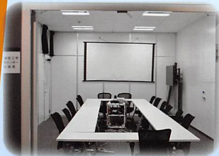
先端医工学研究センター会議室

共同研究の拠点として設置した姫路駅サテライトラボ(姫路駅直近)では、研究員、医産学連携・研究支援コーディネータが常駐し、共同研究の実施、共同研究や技術指導の相談を随時受け付けています。また、医療ビッグデータに役立つデータ解析・可視化計算機を備え、専門的な解析をサポートします。さらに、共同研究推進のための会議室も備えていますので、ぜひご活用ください。医工学研究開発に関するご相談は、お気軽に医産学連携・研究支援コーディネータにお問い合わせください。